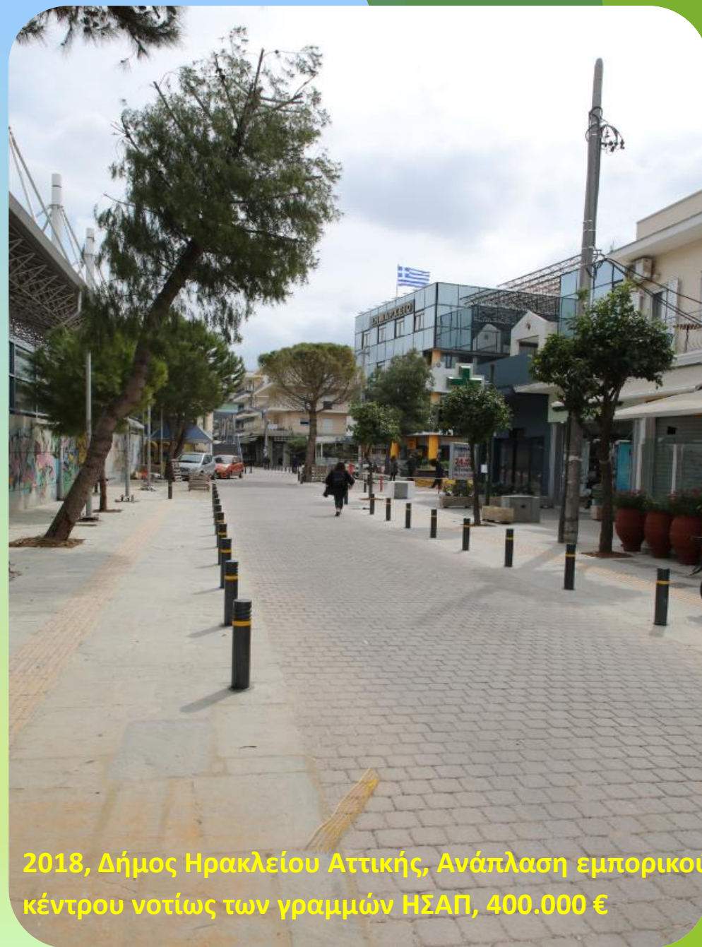
2018, Δήμος Ηρακλείου Αττικής, Ανάπλαση εμπορικού κέντρου νοτίως των γραμμών ΗΣΑΠ, 400.000 €