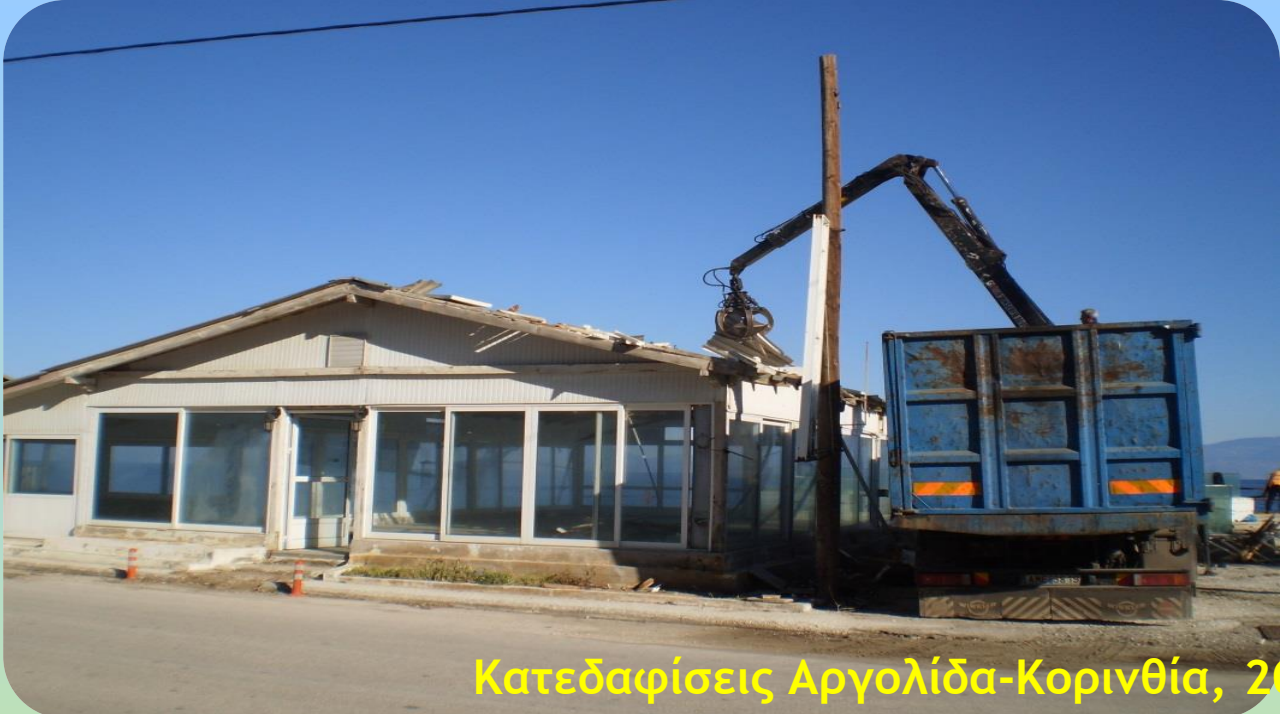
Κατεδαφίσεις Αργολίδα-Κορινθία, 2012-13, Αιγιαλός