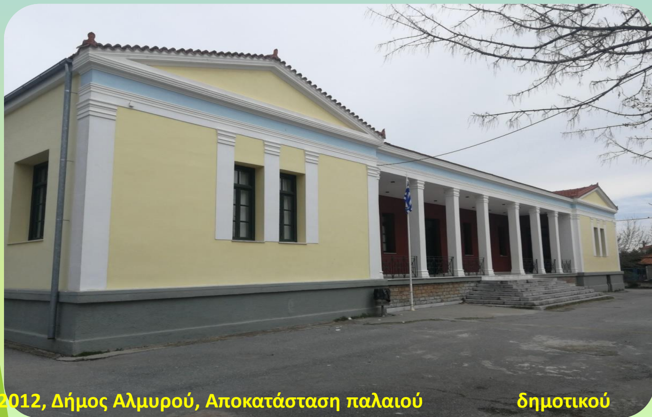
2012, Δήμος Αλμυρού, Αποκατάσταση παλαιού Ευξεινούπολης, 400.000 €