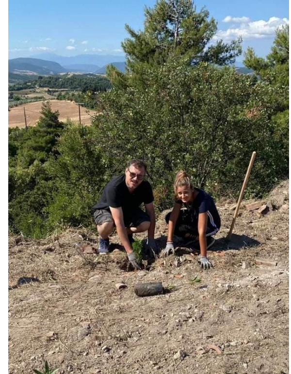
Δήμος Λοκρών, 2020