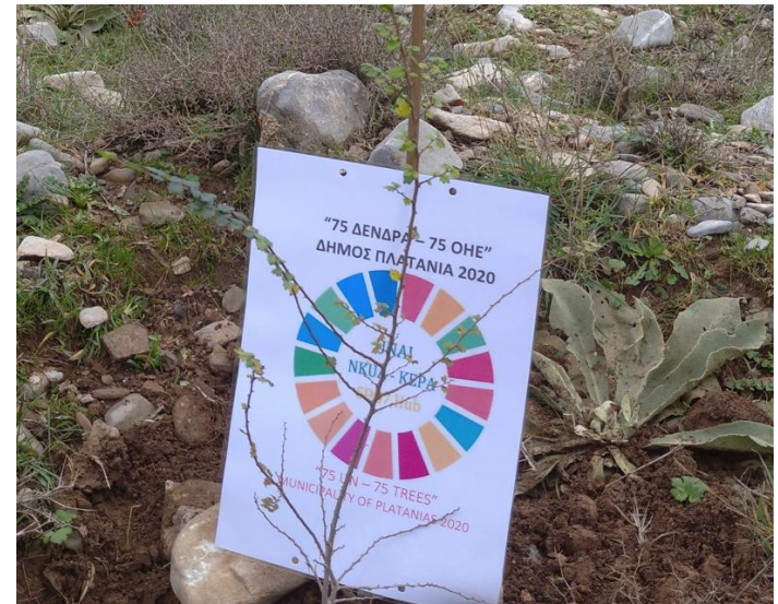
Δήμος Πλατανιάς, 2020