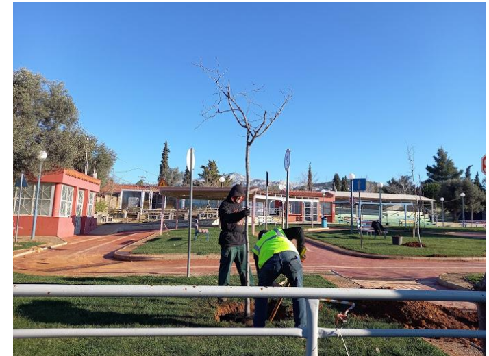
Δήμος Χαλανδρίου, 2020