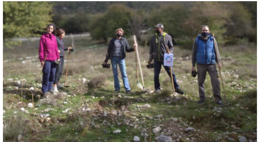
Δενδροφύτευση Δήμου Πλατανιάς (Κρήτη), 2020