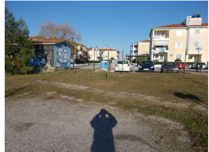
Δήμος Αγρινίου, 2020