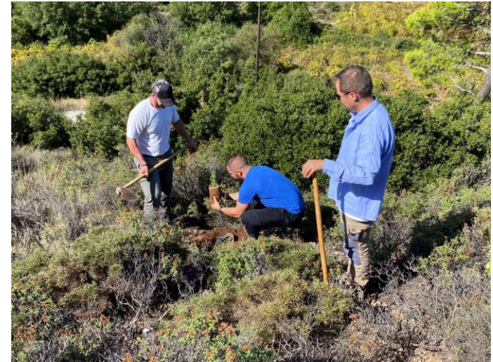
Δήμος Ξυλοκάστρου, 2020