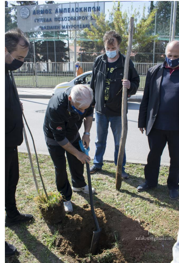
Δήμος Αμπελοκήπων – Μενεμένης, 2021